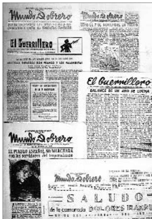
Publicacións clandestinas. | Publicaciones clandestinas.