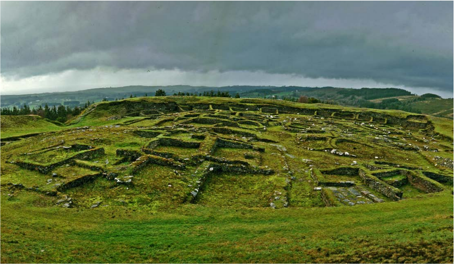
Castro de Viladonga, de Idade de Ferro (Terra Cha, Lugo). | Castro de Viladonga, de la Edad de Hierro (Terra Cha, Lugo).

cultura moi evolucionista ou cambiante cá dun cluster étnico moi definido, aínda que os xenetistas teiman tamén nisto último), dándolles a razón aos vellos dinosauros do romanticismo e as súas escritas escandalosas para moitos honestos estudiosos das novas e non tan novas xeracións. Tanto Cuevillas como o meu pai, fillos daqueles terribles románticos, pero mais informados, deben andar de celebración polos ceos dos maltratados pola penúltima modernidade. Non pola última.