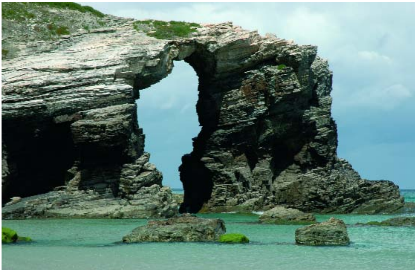
Vista da Praia das Catedrais (Ribadeo, Lugo). | Vista de la Playa de As Catedrais (Ribadeo, Lugo).