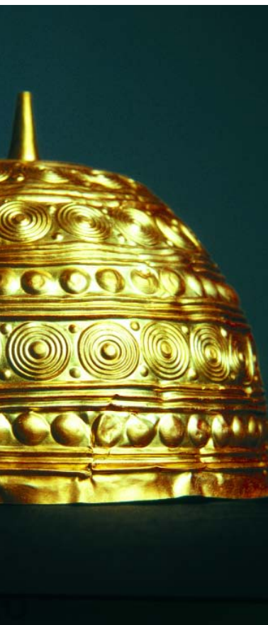
Casco de oro de Leiro.