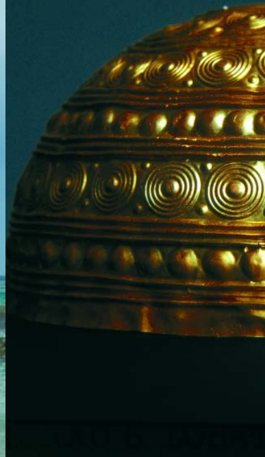
Casco de ouro de Leiro.