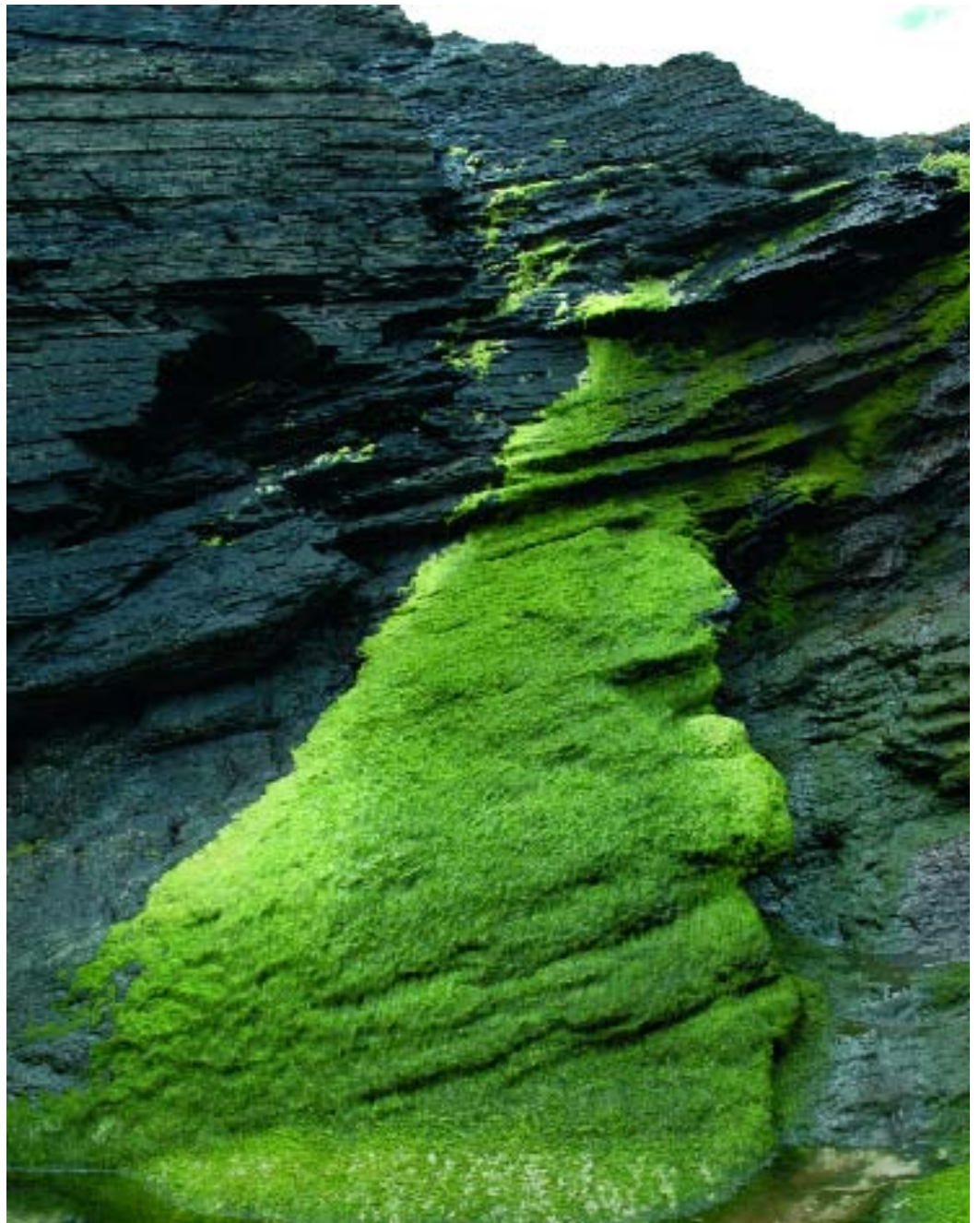
Cantil no norte de Lugo. | Cantil en el norte de Lugo.

os chamados celtas (e xa veremos quen son estes señores) saen de Galicia para o mundo, e non ao revés, como se pensaba. A idea de que os celtas nunca chegaran significativamente a Galicia, defendida con entusiasmo polos desmitificadores de fantasías románticas, era absolutamente certa, se as novas conceptualizacións teñen razón. Quede iso como homenaxe aos que traballaron con fe teimuda na liña contraria á existencia significativa dos celtas galegos, porque isto só é un debate científico. Non chegaron nunca porque ao parecer xa estaban aquí, aínda que toda tese ten os seus buracos e anomalías e é preciso contestar a certas cousas antes de pechar esta afirmación. En realidade, o que está cambiando é a propia idea dunha Europa nacida sobre unhas fantasmas invasións indoeuropeas que traían na mochila, por demais, a raza prístina, ou (como se lle chamou) caucásica, ou ucraína, ou...mil nomes usáronse para erguer o mito ario que todos lembramos horrorizados. As invasións indoeuropeas viñan que nin pintadas para fantasear todas estas cousas que llederon vida ao nazismo. Ata que os arqueólogos comezaron a observar que as pegadas das invasións eran ben febles, ben bretemosas. E nisto