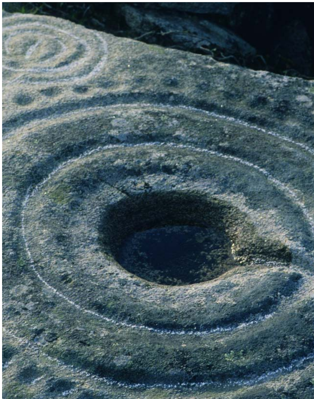
Petroglifo da Idade de Bronce (Muros). | Petroglifo de la Edad de Bronce (Muros).