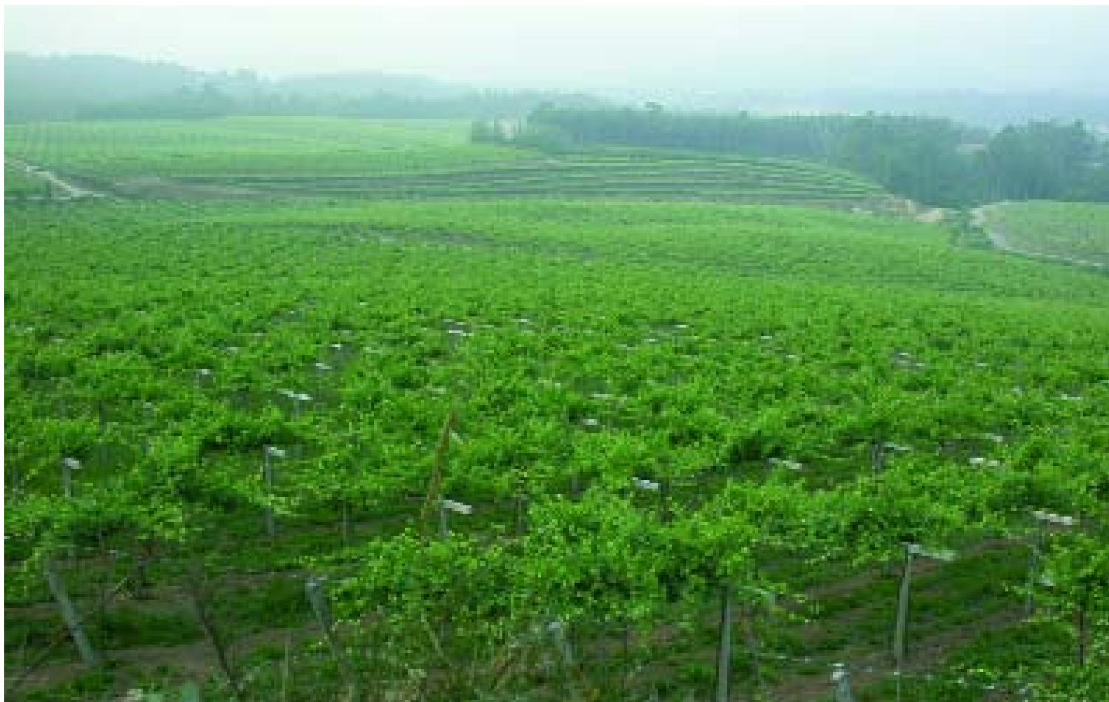
Viñedos das Rías Baixas. | Viñedos de las Rías Baixas.

que xa saben que han de pedilo embotellado, etiquetado e en copa de fino cristal. En canto aos tintos, hai que esquecer para sempre a imaxe dos viños negros servidos nas pulpeiras das feiras, viños que podían estragar para sempre unha camiseta, que se volvían máis escuras canto máis se aclaraban con gaseosa... Viños, como os brancos de antes, máis folclóricos que outra cosa. Hoxe os tintos do Ribeiro teñen tratamento de señoría. Non máis alicante: si ás mencia, sousón, caíño, brancellao e, por que non, a mesmísima tinta fina, que non é outra que a magnífica tempranillo.