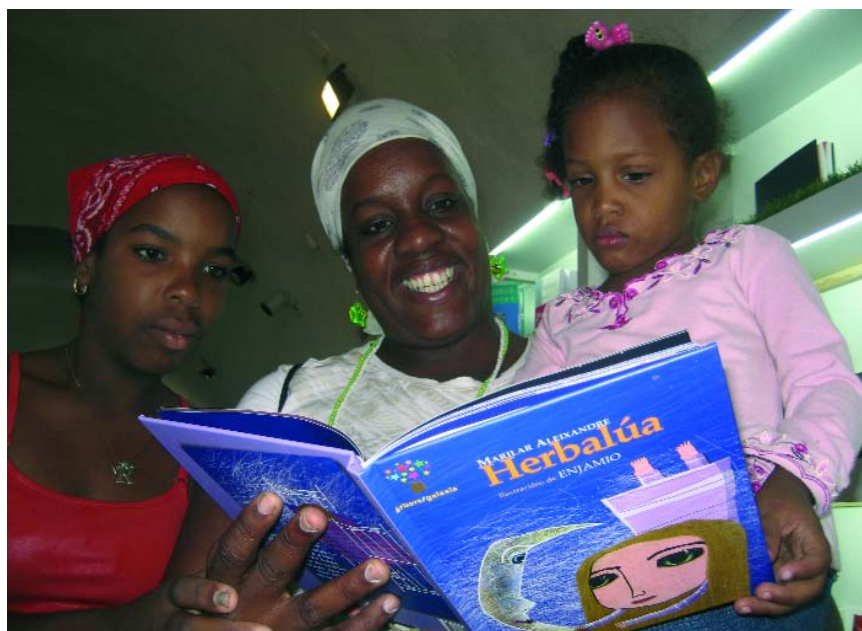
Cubanas ollando con curiosidade un libro en galego. | Cubanas mirando con curiosidad un libro en gallego.

Victor F. Freixanes es director general de la Editorial Galaxia.