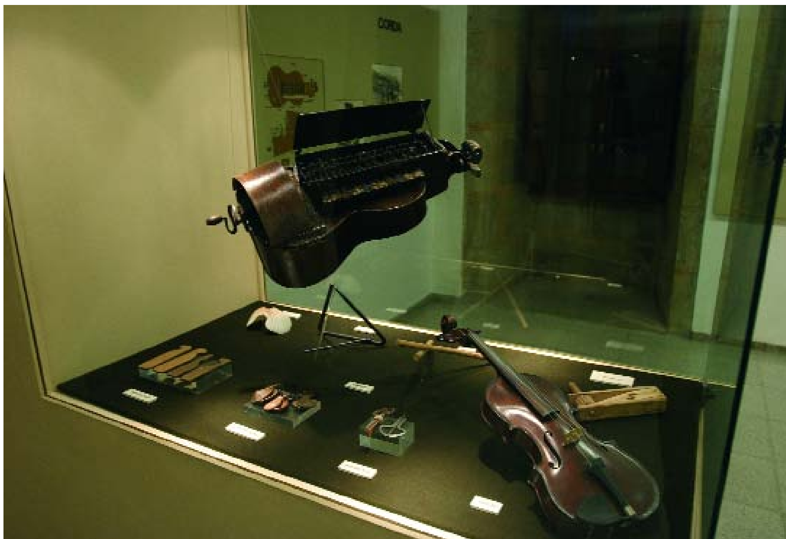
Aspecto parcial da sala de Música. | Aspecto parcial de la sala de Música.

Parafraseando a Stefan Zweig, non sei ata que punto ten validez hoxe en día o legado daqueles homes do Seminario de Estudos Galegos, ata que punto é importante para unha xeración enxordecida polo troupeleio do muíño da propaganda, pero estou certa da confortadora vixencia duns valores relacionados coa ética, a política e a sociedade humana, que encarnaron Xaquín Lorenzo e Antonio Fraguas.