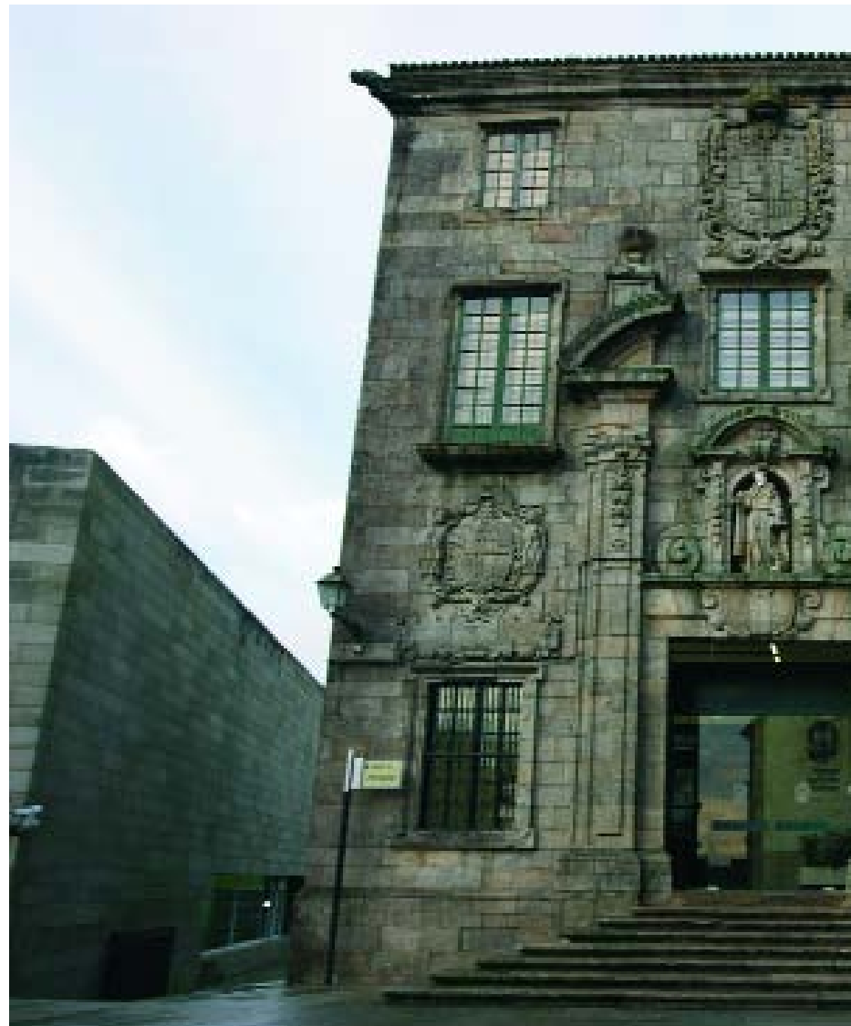
Acceso ao Museo. | Acceso al Museo.