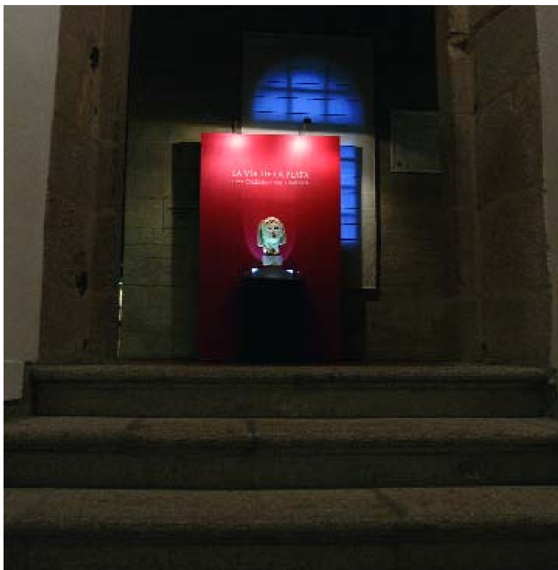
O claustro alto acolle habitualmente exposicións temporais. | El claustro alto acoge habitualmente exposiciones temporales.

O 24 de xaneiro de 1976 marca o punto de partida para unha iniciativa que reavivaba a vella aspiración de contar cun centro no que se reuniran como conxunto ordeado e documentado as manifestacións do quefacer colectivo dos galegos. Os estatutos orixinais enunciaban os fins da entidade: “a investigación, estudo, difusión, conservación, defensa e promoción da cultura galega; e, concretamente, a creación dun museo que recolla as mostras do galego nese eido da actividade humana”.