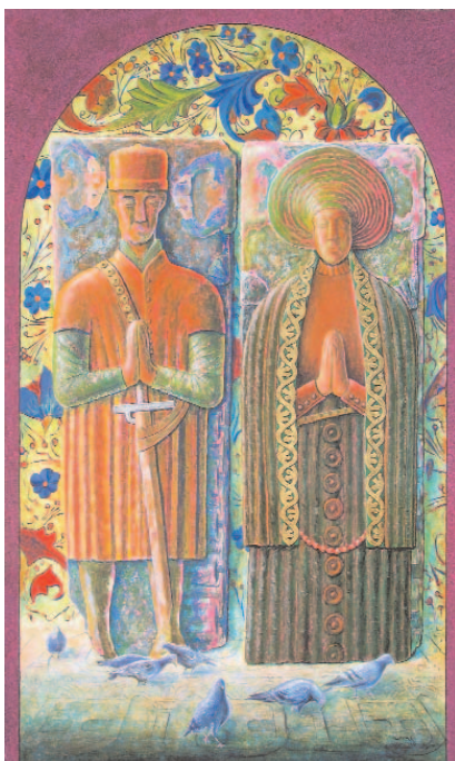
“Afonso de Carvallido” e a súa dona, “Clara Sanches”, t. mixta/táboa, 2006, 118x73 cm, obra de Alfredo Erias da serie “Xente no Camiño”.

E que pasou con Afonso de Carvallido e a súa esposa? Pois, mentres non aparezan documentos ao respecto, non pode saberse. Quizais morreron en plena guerra, polo menos el (pode que antes a súa esposa); enterraríanse neses ostentosos sepulcros (construídos probablemente en vida de Afonso ou seguindo os familiares instrucións súas) dentro da igrexa, nun momento propicio para eles, e logo... Logo véu nestas terras a vinganza do arcebispo e de Diego de Andrade (señor desde 1470 a 1490) e pagarían os seus sepulcros, que serían sacados da igrexa e reempregados indignamente, non sen antes facer desaparecer a cara de Afonso. E o sepulcro do cura? Ben, un sector do clero tamén foi irmandiño. É moi probable que estas laudas sexan a proba dunha especie de damnatio memoriae á maneira antiga. Quen sabe... G