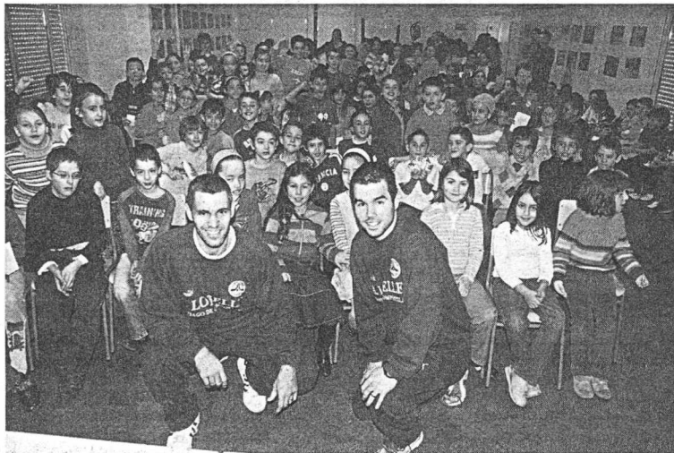
Jugadores del Lobelle visitaron sendos colegios en Fontiñas —en la foto— y en Xoán XXIII