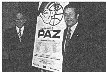
Zaragoza y Ardanza, ayer en Santiago

de adaptar y dirigir la obra a partir del relato del escritor francés Eric-Emmanuel Schmitt, uno de los dramaturgos vivos más representados en todo el mundo.