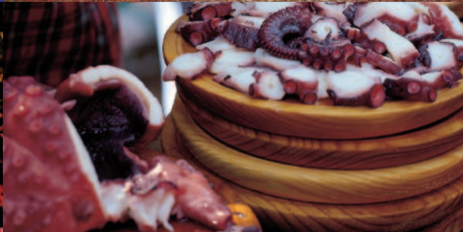
Esquerda: compañía israelí do percusión Mayumaná e concerto na Praza do Obradoiro. Dereita: un tramo do camiño de Santiago e foto do gastronomía cedida por Turgalicia. | Izquierda: compañía israelí de percusión Mayumaná y concierto en la Plaza del Obradoiro. Derecha: un tramo del camino de Santiago y foto de gastronomía cedida por Turgalicia.