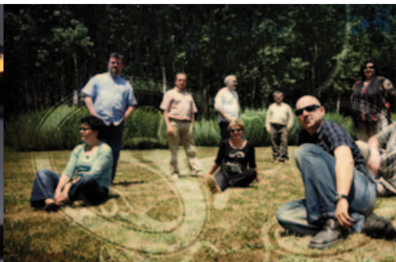
O grupo folk Fuxan Os Ventos. | El grupo folk Fuxan Os Ventos.