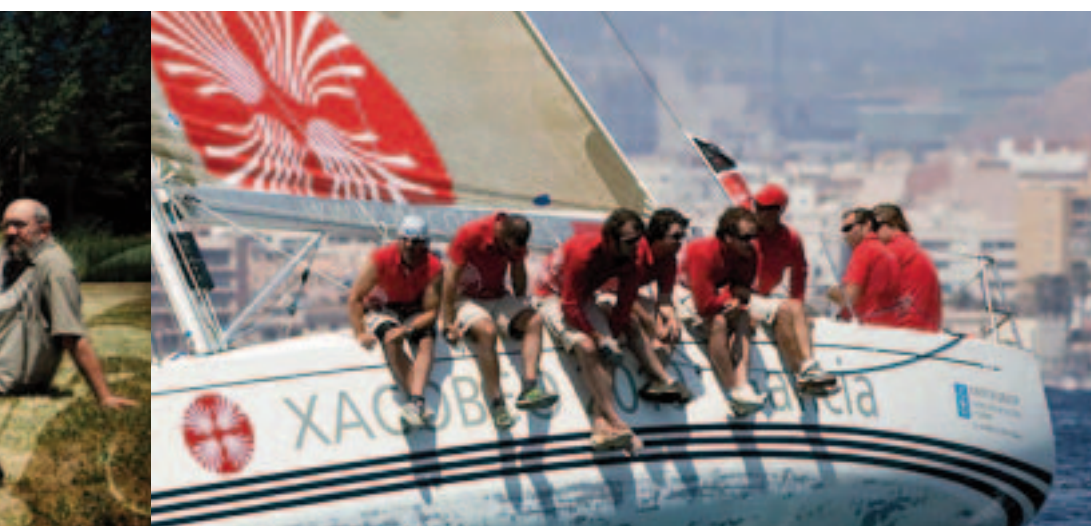
Proxección de imaxe do Xacobeo. | Proyección de imagen de Xacobeo.

Calidad que se perseguirá en la programación, en los contenidos y en la gestión; universalidad a la hora de satisfacer las inquietudes artísticas y culturales de los peregrinos y visitantes de todo el mundo; modernidad que se refleja en la programación, en la imagen gráfica, el uso de las herramientas tecnológicas e informáticas y, en general, en toda la comunicación del Xacobeo; perdurabilidad porque la programación está pensada para que genere contenidos que permanezcan en el tiempo (el próximo Xacobeo será en el 2021); sostenibilidad ya que el Plan de Sostenibilidad 2010 impulsará la conservación del Camino con acciones de recogida selectiva de residuos en albergues, programas de formación y una señalización que