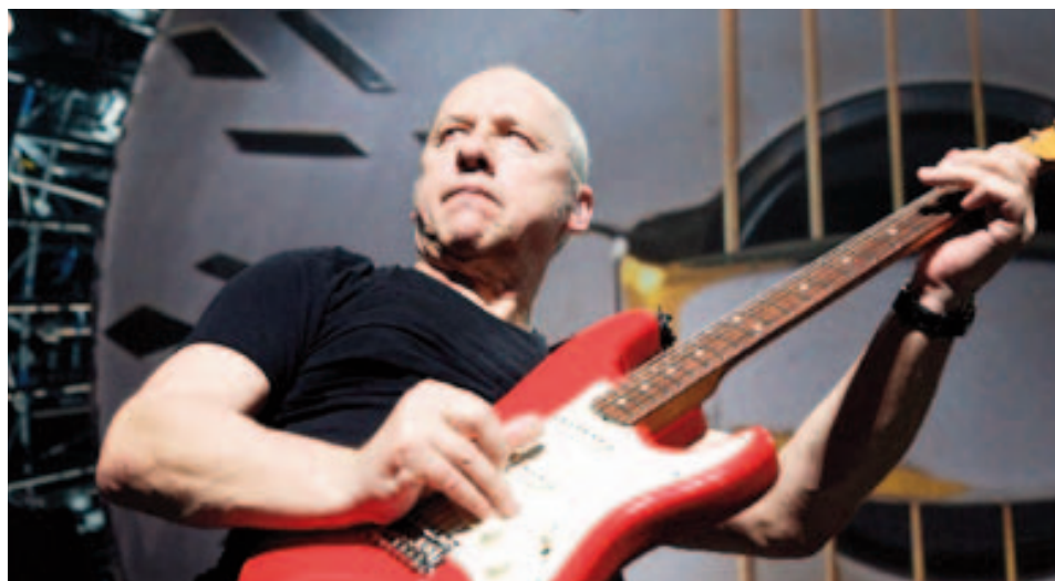
Mark Knopfler. | Mark Knopfler.

Los más pequeños de la casa tampoco se quedan al margen de las grandes líneas de programación del Xacobeo 2010, con un paquete de actividades pedagóxicas que se desarrollará en los centros educativos de Galicia y España. La iniciativa se enriquece con un concurso escolar que contribuirá a divulgar la esencia del Camino en más de 300.000 hogares.