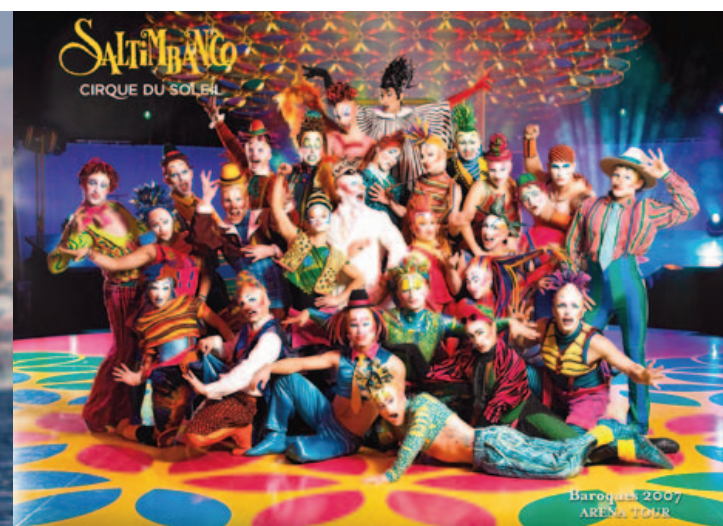
Cirque du Soleil. | Cirque du Soleil.