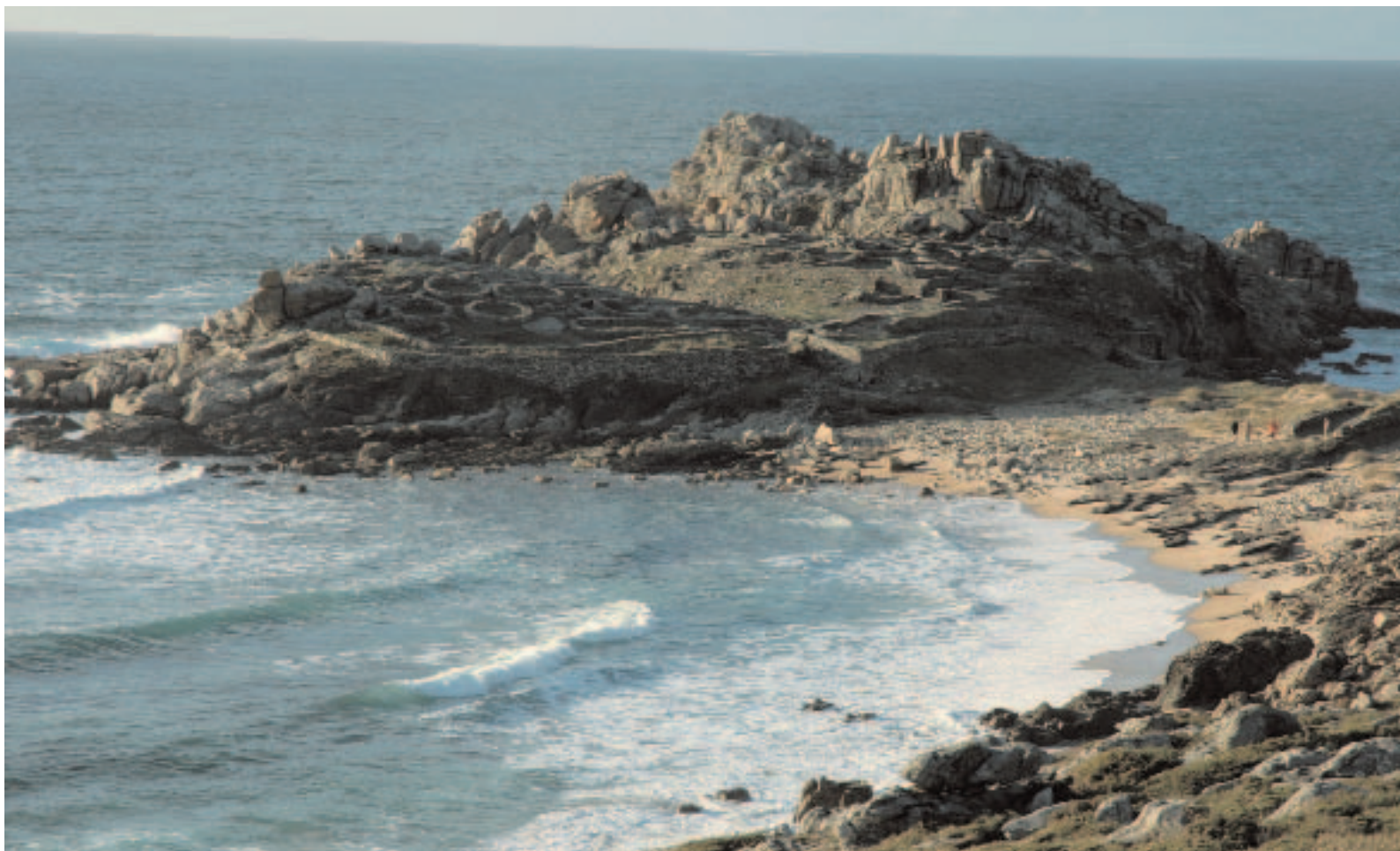
Castro de Baroña (A Coruña). | Castro de Baroña (A Coruña).