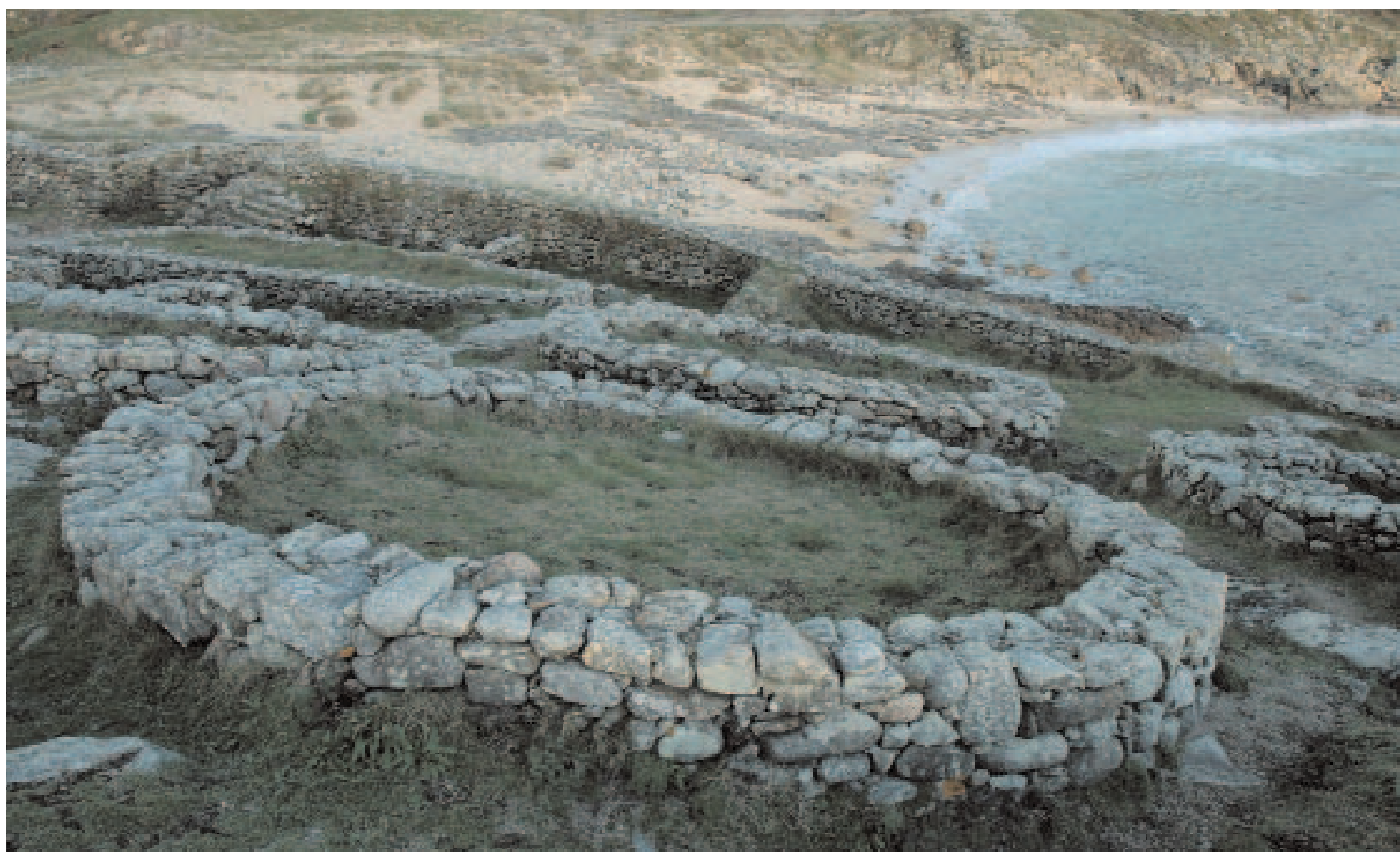
Castro de Baroña (A Coruña). | Castro de Baroña (A Coruña).

carece na actualidade dos valedores que tivo no seu día. Estes valedores, alén dos máis populares (do estilo da música “celta”), atópanse hoxe máis entre os lingüistas do que entre os historiadores e, nomeadamente, entre os arqueólogos. Naturalmente, tampouco se invoca a condición celta para definir politicamente a Galicia actual. A forza do celtismo devalou abruptamente, de forma parella a como foi decaendo a visión racial da historia no pensamento europeo da segunda metade do século XX. Isto permítenos concluir cunha observación evidente, pero que durante moito tempo estivo ocluída ou esquecida: que a etnia galega é unha rosa de moitas follas, que está composta de moitas achegas diferentes.