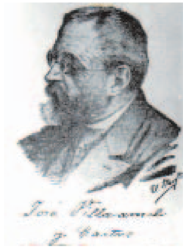
Villamil y Castro

de Sánchez Moguel, asevera o noso historiador que os “pobos do noroeste”, en razón da súa historia, lingua e sentimentos, constitúen unha “nación con caracteres propios, claramente distintos dos que configuran o Estado español”.