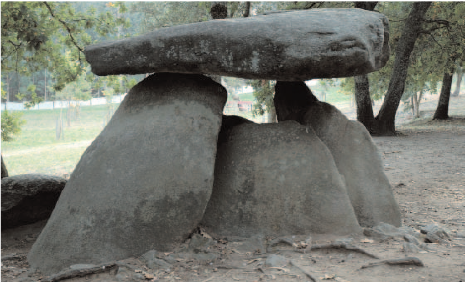
Dolmen de Axeitos (A Coruña). | Dolmen de Axeitos (A Coruña).

existiren textos escolares que contasen a súa historia, que debería comezar pola sentenza de “os nosos devanceiros, os celtas” e acreditar que dos celtas derivaba o lirismo e o amor á terra que supostamente caracterizaba xa aos celtas que habitaban Galicia antes da chegada dos romanos. Estes textos non existiron, pero a aceptación común, mesmo popular, do celtismo foi enorme. Malia algunhas controversias menores, a visión de Murguía triunfou plenamente no seu tempo.